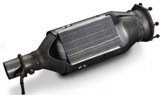
2008 FORD SUPER DUTY DIESEL PARTICULATE FILTER (DPF)

Seveda pa tudi odprava vseh teh napak ni zagotovilo, da bo DPF filter pravilno in dolgo deloval, saj je za to potrebnih še kar nekaj pogojev. Tu je najprej uporaba pravilnega motornega olja za standarde vozil z DPF filtri. Nadalje nepoškodovane povezovalne tlačne cevke med odvzemnimi točkami na filtru in tlačnim senzorjem. Zatem je potrebno preveriti rezervoar za tekočino za dodatek v gorivo. Še največkrat pa so vzročne težave za napake na DPF filtru nepravilno delovanje motorja na sesalnem sistemu (počene ali predrsanе cevi) ali nepravilno delovanje turbine na vozilu. Velikokrat je težava tudi na EGR ventilu, ki nepravilno deluje in zaradi tega pride do precej prevelikega dimljenja motorja. Vseh teh napake pa zaradi DPF filtra sploh ne opazimo do takrat, ko nam sistem na vozilu ne zazna bodisi prekomerne tlačne razlike ali pa da se regeneracija zaradi nekega vzroka ne more začeti.